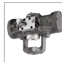
Agitador modelo R (Opción). Kit 105451* L20 agitador alternativo para depósitos 183S-1012-CE & 183G-1012-CE

Nota: Los depósitos Binks son entregados con conectores NPS estándar. Para los conectores BSP, añadir "B" a la referencia. Ejemplo: 183S-210-CE-B