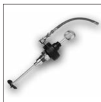
Agitador modelo D

R Moto-Reductor neumático Alternativo - El movimiento alternativo a 180° permite una excelente agitación de todos los tipos de productos. Una calidad especialmente importante para los productos a base de agua que tienen reacción a las cortaduras de metal. Consumo de aire muy reducido.