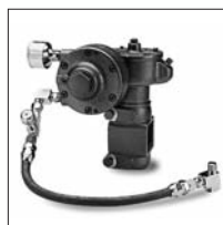
Agitador modelo I