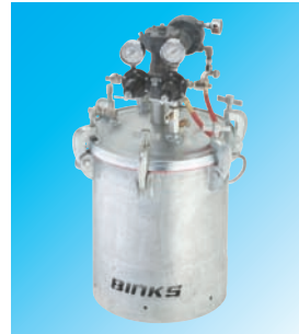
Foto mostrando los doble reductores de presión de aire, en opción.